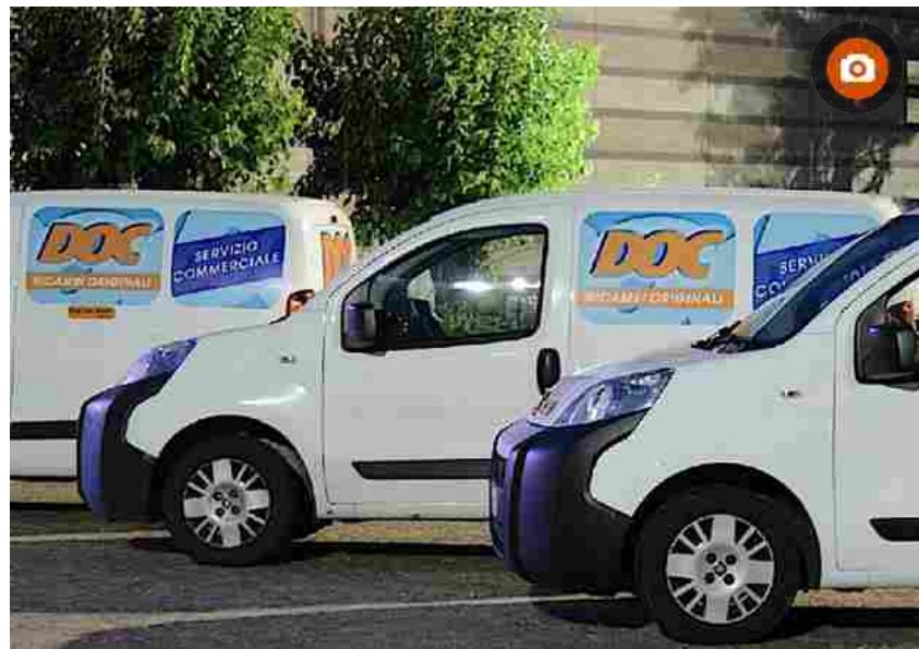
Per DOC Ricambi Originali fatturato 2018 a 60 mln euro