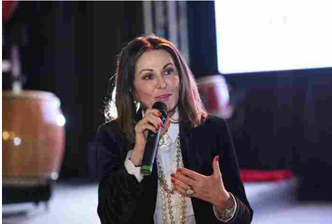
La senatrice Daniela Santanché

Industria, Commercio e Turismo del Senato